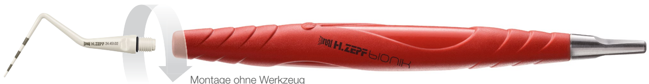
Montage ohne Werkzeug