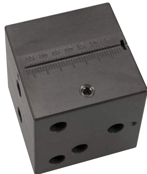
Lineal 37 mm, kalibriert