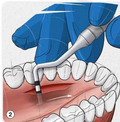
② Präparation zu BG-Gewinnung anhand des Instruments